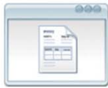
Gestión de Compras Presupuestos y Órdenes de Compras