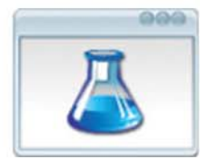
Gestión de Productos Bases de Datos de Productos