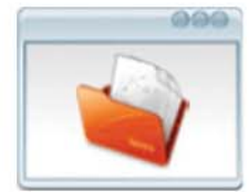
Facturación Facturación de Trabajos y Seguimiento