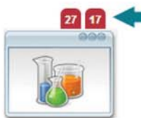
Sistema de Alertas Alertas Automáticas para facilitar el Trabajo