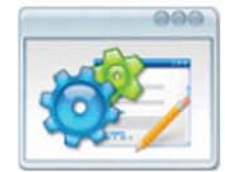
Configurar Trabajos Configuración de Servicios de Laboratorios