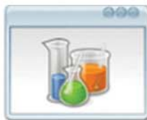
Gestión de Equipos Clasificación de Equipos