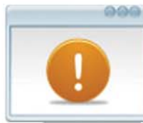
Gestión de Desviaciones Tipos y Registros de Desviaciones