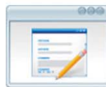
Pantalla de Trabajos Registro, Asignación y Seguimiento