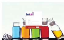
Área de Clientes Acceso Privado con Enlace por E-mail