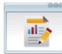
Informes de Resultados Generación y Envío de Informes Result.