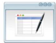
Datos para Seguimiento Configuración Datos de Registro