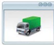
Gestión de Proveedores Registro de Datos de Proveedores