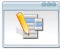
Gestión de Departamentos Dentro de una misma Organización