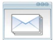
Envíos de Información Generación de Listados y Envíos