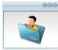
Gestión de Clientes Clientes y Solicitantes de Trabajo