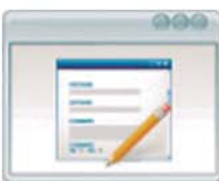
Pantalla de Trabajos Registro, Asignación y Seguimiento