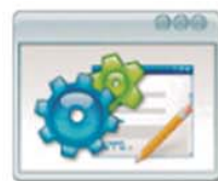
Configurar Trabajos Configuración de Servicios de Laboratorios