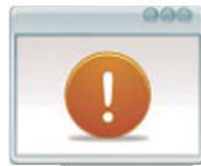
Gestión de Desviaciones Tipos y Registros de Desviaciones