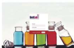
Área de Clientes Acceso Privado con Enlace por E-mail