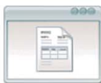
Gestión de Compras Presupuestos y Órdenes de Compras