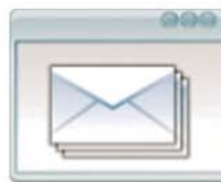
Envíos de Información Generación de Listados y Envíos