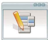
Gestión de Departamentos Dentro de una misma Organización