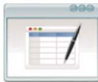
Datos para Seguimiento Configuración Datos de Registro