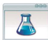
Gestión de Productos Bases de Datos de Productos