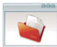
Facturación Facturación de Trabajos y Seguimiento