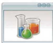
Gestión de Equipos Clasificación de Equipos